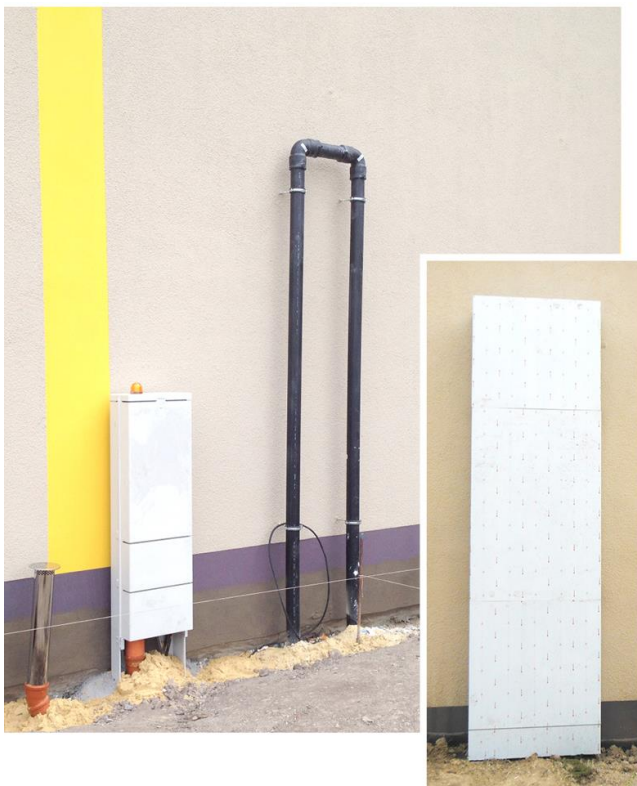
Bild 4: Erfolgt die Installation der Rückstauschleife außerhalb des Gebäudes, muss ein Frostschutz berücksichtigt werden.