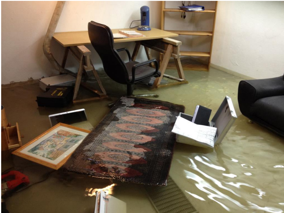
Bild 2: Überflutung eines Kellerraumes nach einem Starkregen, die Elementarschadenversicherung zahlt bei bestimmten Voraussetzungen.