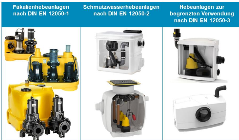
Typen von Hebeanlagen gem. EN 12050 (Jung Pumpen GmbH)

Teil 3: Hebeanlagen zur begrenzten Verwendung