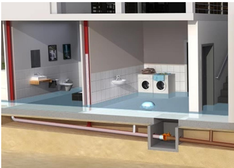
Bild 5: Bei Verwendung eines Rückstauverschlusses als zentrale Absicherung besteht die Gefahr einer Flutung der Räume von innen.