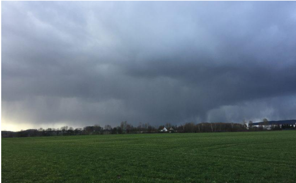
Bild 1: Lokal auftretende Starkregen nehmen zu und sind schwer vorherzusagen